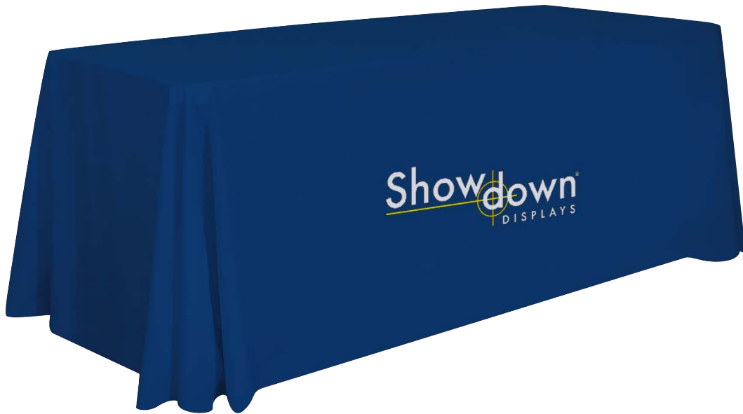
TABLE COVER STANDARD AND ROYAL STANDARD